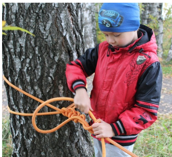
Рисунок 2. «Прямой узел»

Отправляясь с ребенком на улицу у вас появится возможность вместе с ребенком создать свой «веревочный парк».