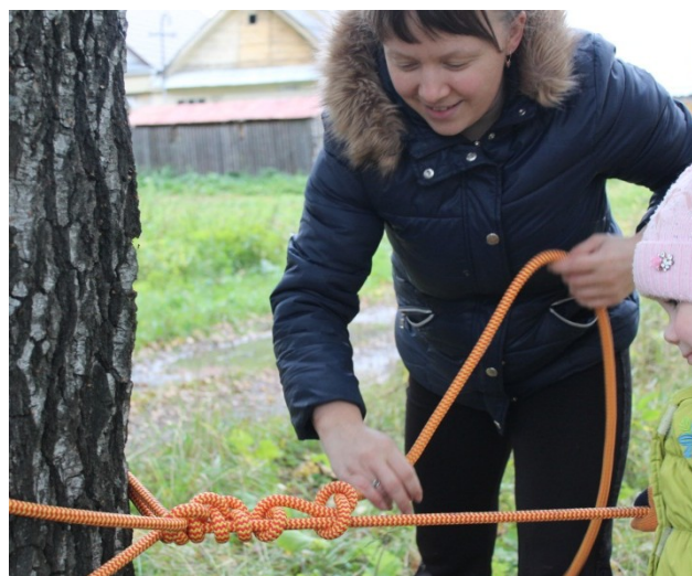
Рисунок 3. «Узел проводник»