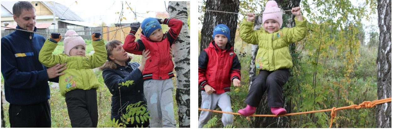
Рис. 5,6. «Веровочный парк»

Вместе с ребенком можно придумать игровые упражнения на координацию рук, ловкость при передвижении. Например, игровое упражнение «Змейка», натяните резинку в хаотичном порядке в виде дорожки 3-4 метра в длину, 1 метр в ширину, 30-50 сантиметров от земли (в зависимости от возраста ребенка). Ребенок проходит по дорожке, не задевая резиночку ногами. На резиночку вешаются колокольчики, для того, чтобы было слышно задета была резиночка или нет. Игру можно постоянно усложнять разнообразными упражнениями (пройти только по красным резиночкам, пролезть только под зелеными и т.д.).